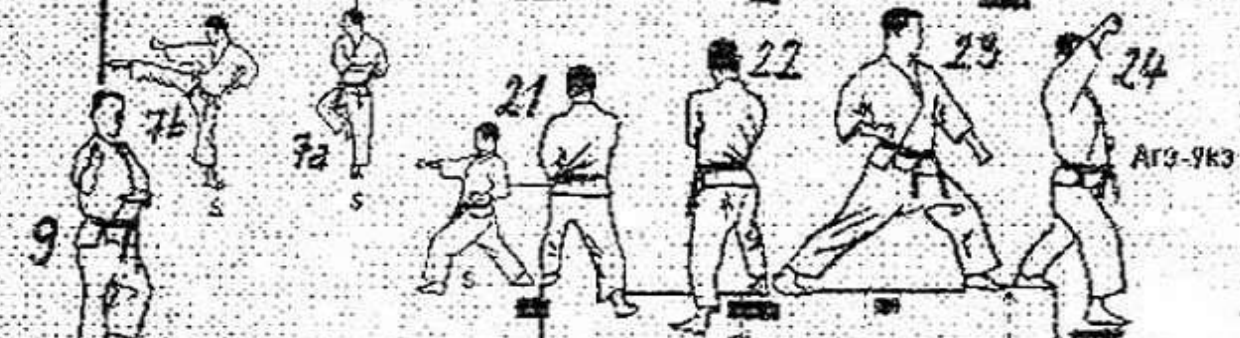
СХЕМА-КАТА (ТРАЕКТОРИЯ ДВИЖЕНИЯ)